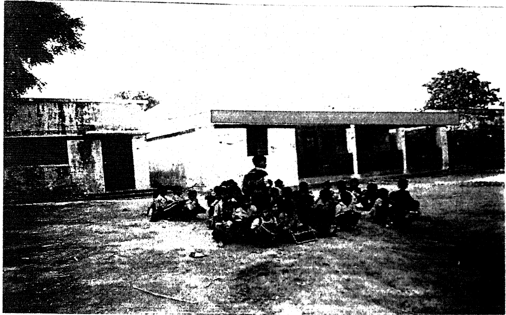
बाल श्रमिकों का शैक्षिक पुनर्वास